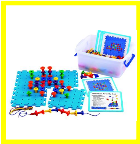
Мозаика PEG BOARD большая. Набор для группы Артикул 39495С