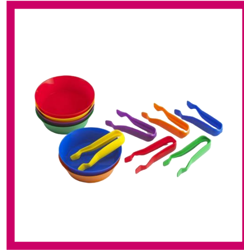
Чашки и пинцеты. Набор для сортировки Артикул 13905