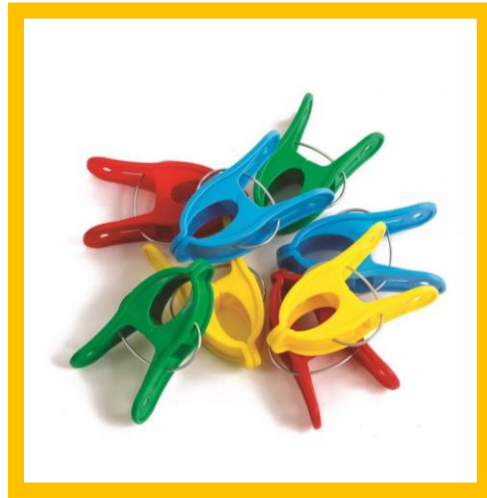
Гигантские скрепки Артикул 89423