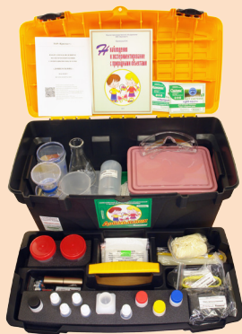
Набор в открытом виде