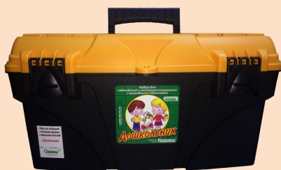
Набор в закрытом виде