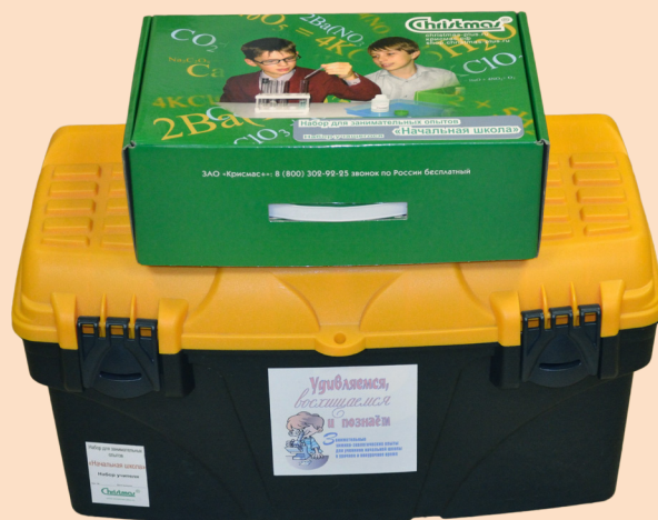
Набор учителя и набор учащегося в закрытом виде